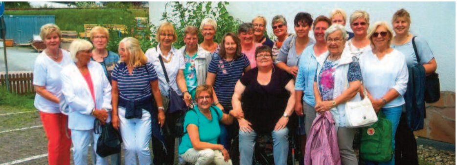
Ausflug der Frauengruppe Derne

Die weiteren Gruppen der Abteilung Turnen wie z. B. Männerturnen in Derne und Kirchnerde, Kinderturnen, Senioren, Frauenturnen in Derne und Kirchnerde sowie Yoga und Qi-Gong sind ebenfalls gut besucht. Jedoch können gerne jederzeit Interessierte bei den Gruppen einsteigen und mitmachen. Alle werden herzlich aufgenommen.