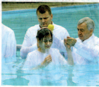
Taufe im Derner Freibad: Die Gemeinde der Mennoniten aus Kirchnerne unternahm am Sonntag einen Ausflug zum Sperrfeld, um eine traditionelle Taufe im Wasser vollziehen zu können. 200 Gemeindeglieder aus der gesamten Umgebung kamen. Das Ritual findet bereits seit mehreren Jahren jährlich im Derner Freibad statt.